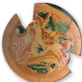
Afb. 3 Gedecoreerd bord uit productieafval Husum.