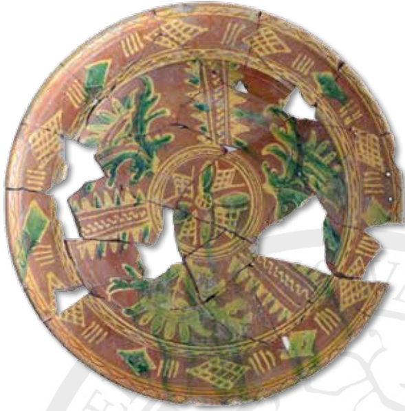
Afb. 3a Het rood aardwerken bord (r-bor-46) uit de afvalkuil met wilde bloemversiering en groene accenten.