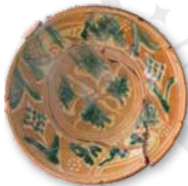
Afb. 4 Gedecoreerd bord uit productieafval Husum.

se traditie en de ringeloor invulling zoals in de Hollandse decoratiewijze. In Husum is geen sprake van 'slagroomsput' dikke slib maar van een nette dunne laag. Combinaties bestaan uit geometrische, non-figuratieve decors met parallelle zigzags en chevrons zoals ook in Ochtrup en het Wesergebied plaatsvindt, maar ook met Bijbelse voorstellingen als herten, vissen, duiven en granaatappels met een meanderende ringeloor rand (= laufender Hund ) zoals uit de Hollandse rood-aardewerk traditie. Kenmerkend is daarbij de vlakverdeling van bloemmotieven als tulpen, chrysanten en distels op de vlag; een kniphoog naar de majolica en een verbastering van het porselein uit deze tijd. De likken groen uitgelopen koperglazuur geven de decors nog meer dynamiek. Juist dit element maakt het aardewerk uit Husum herkenbaar.