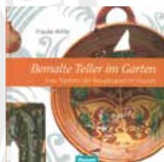
Afb. 1 Omslag.

Op een enkele uitzondering na is al het geproduceerde materiaal roodbakkend. Het gaat behalve om kacheltegels vooral om alledaags vaatwerk. Het overgrote deel is versierd, en dat zorgt voor herkenbaarheid van het Husum-materiaal. De kommen, borden en koppen zijn op een krachtige en expressieve wijze wild en uitbundig versierd. Waar bij het North-Holland Slipware , dat in onze contreien veelvuldig wordt gevonden, nog enige precisie is betracht door een combinatie van slib, kras en kleuraccenten, is bij het Husum materiaal vooral de ringeloor gebruikt voor concentrische cirkels zoals in de Nederrijn-