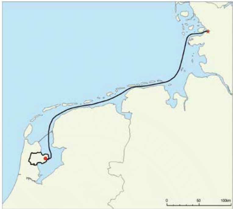
Afb. 5 De route van het rundveetransport over Noordzee en Waddenzee, ster = Husum, stip = Bovenkarspel.

in panelen vier grote bloemen opgezet met eveneens twee grote bladeren. De bloem en kelkbladen zijn meer tulpvormig dan op het andere bord. De panelen worden gescheiden door een meander. Centraal staat een abstract bloemmotief met een punt in het midden en afwisselend bladvormige en kelkvormige bladen. Bijzonder aan dit bord is dat het loodglazuur geheel over de bovenzijde van het bord is gegoten, waardoor het hele bord groen is geworden. Op de plekken van het witte slib vertoont de koperloodglazuur kleine putjes. Dit geeft aan dat er een reactie tussen het kopervijlsel en de kalk van het slib heeft plaatsvonden. Bij de rode slib van de donkergroene delen is dit niet het geval. Wel hechtte de rode slib minder goed en zijn enige stukken afgebladderd.