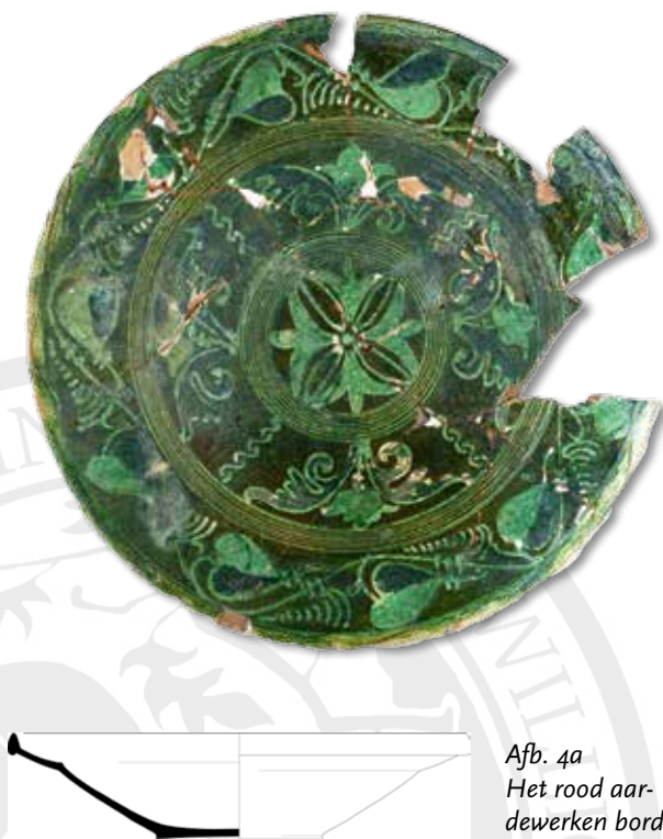
Afb. 4a Het rood aardewerken bord (r-bor-46) uit dezelfde afvalkuil met groen loodglazuur, druivenranken en gestileerde bloemen.

Het tweede bord heeft een diameter van 38,5 cm, een hoogte van 8 tot 9 cm en een standvlak van 14 cm. Het bord is daarom nogal scheef. Ook dit bord heeft ophanggaten. Afdrukken van oveninventaris en glazuurspetters zijn niet te zien op de achterzijde. Het decor is iets zorgvuldiger opgezet dan bij het eerste bord en bevat vergelijkbare kenmerken. Ook dit