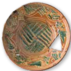
Afb. 2 Gedecoreerd bord uit productieafval Husum.