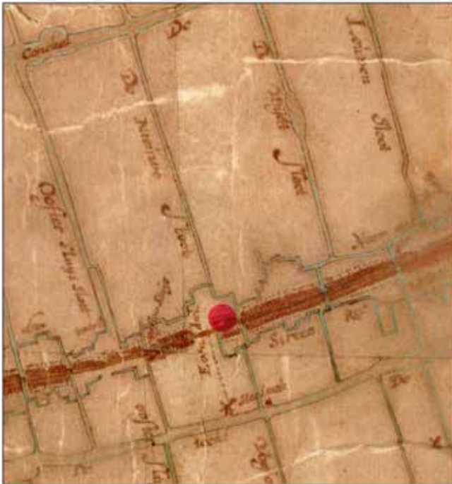
Afb. 1 De locatie van de opgraving in Bovenkarspel aangegeven door de rode stip op de kaart van Johannes Dou (1651).

De West-Friezen waren in de Gouden Eeuw (1575-1675) zeer ondernemend en kwamen zo tot grote welstand. De bevolking legde zich onder meer toe op vrachtaart, grondstoffenhandel, houthandel, landbouw en veeteelt. Mestvee werd in de 16e en 17e eeuw op grote schaal geïmporteerd vanuit Jutland (Denemarken) en vervolgens op de grazige West-Friese weides vetgemest. In tegenstelling tot veel historische bronnen zijn er tot onlangs maar zelden materiële zaken in de bodem aangetroffen die op deze handelsbetrekkingen duiden.