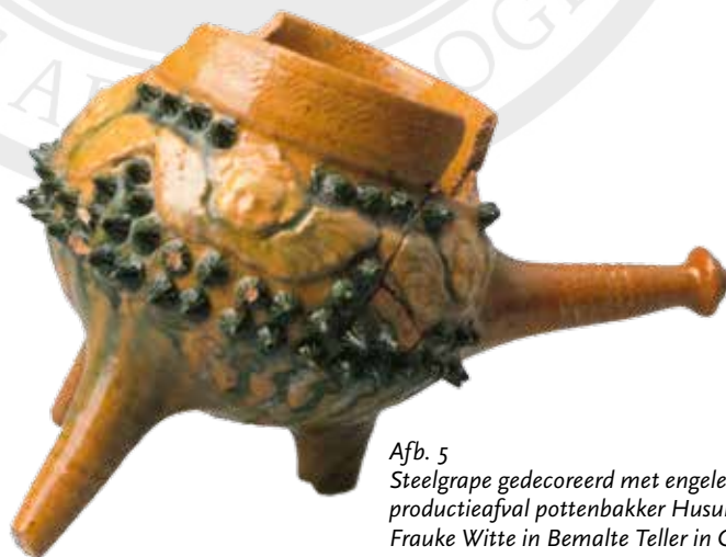
Afb. 5 Steelegrape gedecoreerd met engelenkopje, uit productieafval pottenbakker Husum D.).