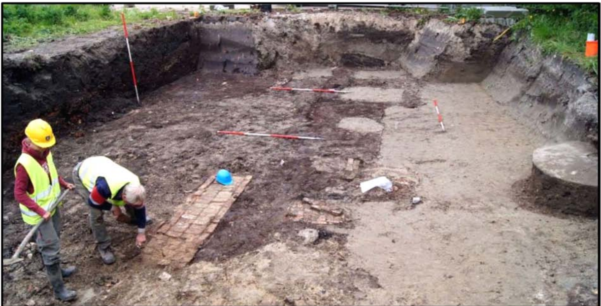
Rechts op de foto is de molensteen blootgelegd

Tijdens een archeologisch onderzoek in 2012 aan de Hoofdstraat 23/29 nabij het oude postkantoor, werd er een molensteen opgegraven. De molensteen was gebroken en niet compleet, de steen functioneerde als deksel van een oude waterput. Het is zeer waarschijnlijk dat de gebroken molensteen van korenmolen 'De Vrede' nu weer gevonden is. De korenmolensteen dient nu als decoratieve begrenzing bij de fietsenstalling van korenmolen 'Ceres'.